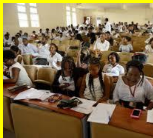
Inkijkje in de universiteit