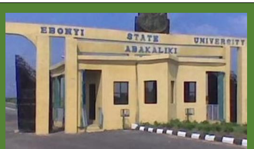
De universiteit van Abakaliki