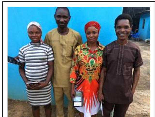
Enkele ex-gedetineerden die hun dank uitspraken. De één kwam met zijn vrouw, de ander met zijn dochter die ook in ons studiefonds zit.