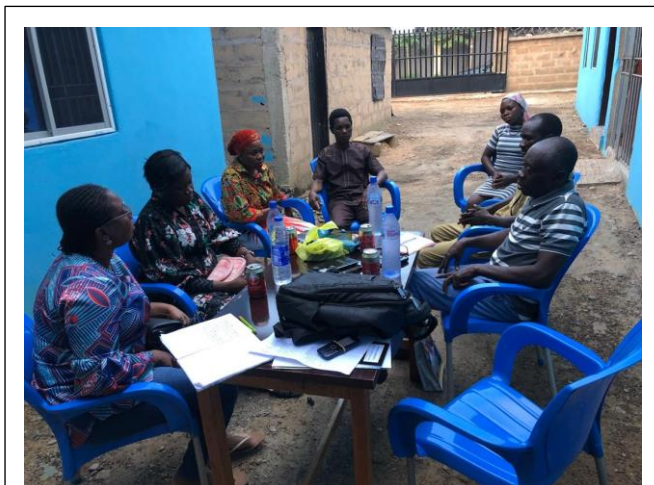
Op deze foto een deel van ons 'Nigeriaanse bestuur voor het gevangeniswerk' met enkele ex-gedetineerden (plus familie) die hun dank uitspraken.