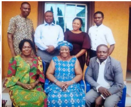
Board members and Support Staff after their meeting

'Roept uit aan alle stranden, verbreidt van oord tot oord, verkondigt alle landen, het Evangeliewoord!'