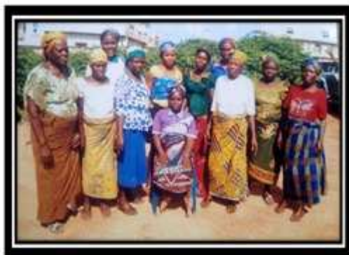
Group picture of widows in center 1 & 2. One of the widows, Mrs. Cecilia Nwagor did not appear in the picture because she could not reach the center on that day.